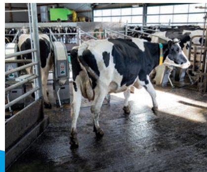
Свободное и непрерывное движение