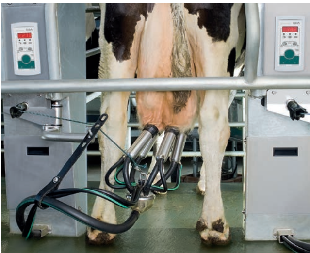
PosiGuide: автоматическое снятие

Больше комфорта и гигиены с PosiForm: рука подключения поднимает доильный аппарат на удобную для работы высоту! EasyStart запускает пульсацию и подводит вакуума при подключении. После снятия PosiForm опускает доильный аппарат и проводит его в чистоте под платформой в зоне входа-выхода животных.