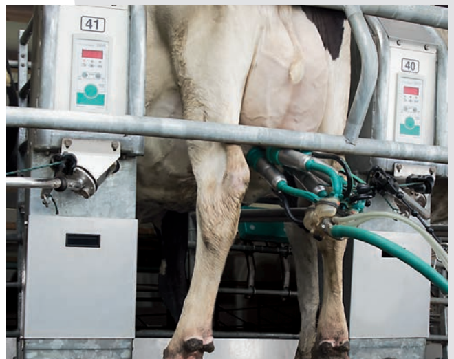
PosiForm: автоматическое снятие и опускание