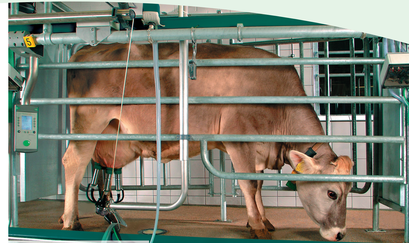
Доильный бокс АвтоТандем