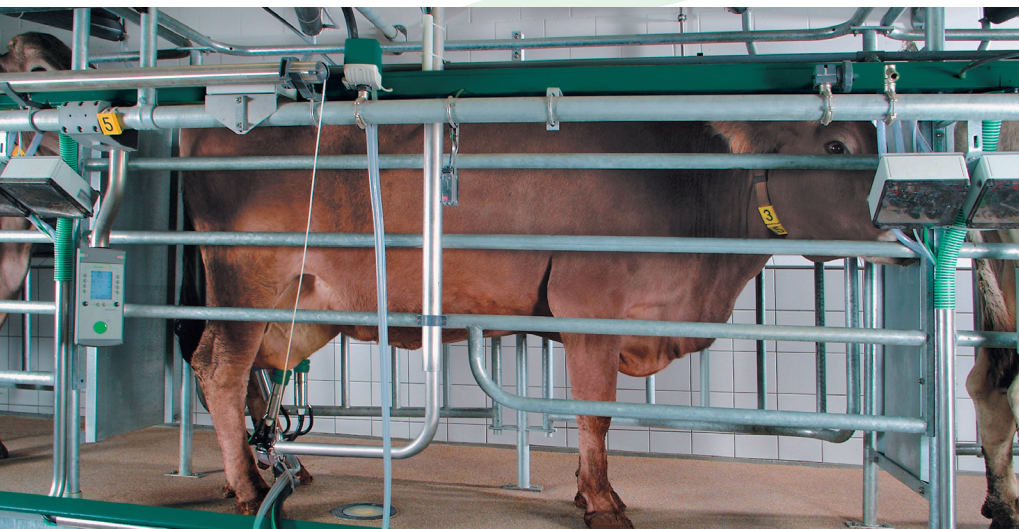
Доильный бокс АвтоТандем